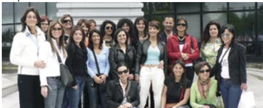
Nella foto le Estetiste e le loro clienti che hanno vinto il viaggio a Parigi

• l'attrezzatura ultramoderna dei laboratori di metrologia permette di misurare l'efficacia dei prodotti e dei trattamenti