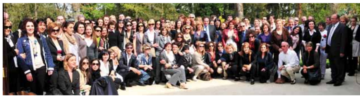
Il Gruppo Italia in visita alla Fabbrica e ai Laboratori Guinot-Mary Cohr-Masters Colors.

1986-2011 - 25 anni di attività, un traguardo importante che il Gruppo Guinot-Mary Cohr Italia ha voluto festeggiare organizzando un soggiorno indimenticabile a PARIGI condividendo con clienti e collaboratori divertimento, emozioni e momenti interessanti dal punto di vista professionale.